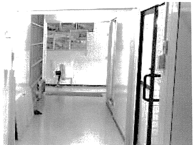
脱衣所(奥にサーキュレーター)