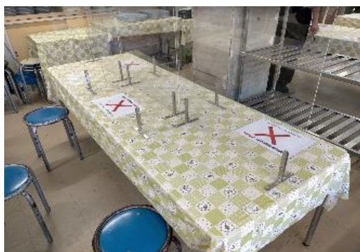
食堂のテーブル（パーティション設置）