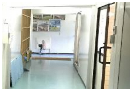
脱衣所（奥にサーキュレーター）