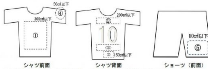
図3 <広告の掲示（場所及びサイズ）> （本規程 第7条）